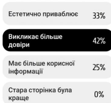
Рис. 4. Результати опитування на сторінці Instagram [16]

3. Впровадження онлайн прийомів пацієнтів – це зменшить кількість контактів один з одним, а отже людина буде почуватись у безпеці відносно зараження на COVID-19 під час дороги та самого візиту до лікарні. Також це значно економить час, що є також значною перевагою для сучасної людини.