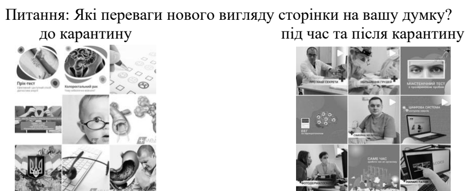
Рис. 3 . Вигляд сторінки «Мед-Союз» в Instagram до та після карантину [15]

Також, виходячи з опитування на сторінці у соціальній мережі Instagram, було доведено, що новий візуал сторінки викликає більше довіри у 42% підписників, естетично приваблює 33% та 25% людей зазначили, що отримують почали отримувати більше корисної інформації (рис. 3-4).