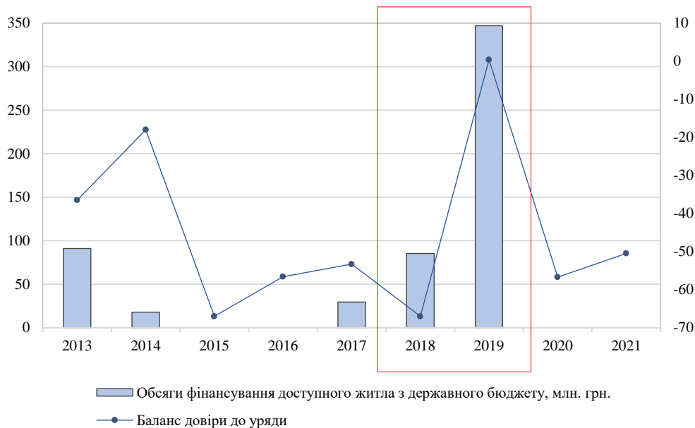
Рисунок 3 – Динаміка показника балансу довіри до уряду в Україні та динаміка обсягів фінансування програми «Доступне житло» з державного бюджету за 2013-2021 роки

Таке ставлення громадян до Уряду України пов'язано з політичними проблемами в державному апараті (Революція гідності, зміна політичних лідерів) та кризовими явищами в країні (президентські вибори, пандемія COVID-19), що припали на ці роки. Окрім цього, простежується закономірність у зміні обсягів фінансування доступного житла та рівня довіри до державного сектору. Так сталося, що саме в роки найнижчої довіри громадян, з державного бюджету майже не виділялися кошти для забезпечення громадян доступним житлом. А в 2019 році можна спостерігати найвищий рівень довіри громадян до уряду за весь період аналізу, що співпадає з найбільшими обсягами фінансування, так, з державного бюджету у 2019 році було виділено 347 млн. грн.. Таким чином, можна зробити висновки, що галузь доступного житла не є пріоритетною для керівництва країни у кризові періоди, а кошти для забезпечення житла виділяються лиш місцевими бюджетами. Довіра громадян до державного сектору, це комплексне та мультиаспектне поняття, на яке впливає безліч факторів, проте дані рисунку 3 свідчать про зв'язок фінансування доступного житла, як напрямку соціальної політики, та рівня довіри до уряду. Слід додати, що в періоди економічно-політичної невизначеності, фінансування доступного житла є досить важливим, оскільки завдяки таким діям держава зменшує рівень невизначеності, формує позитивні очікування громадян, сприяє підвищенню стабільності та довіри, необхідних для сталого економічного та соціального відновлення.