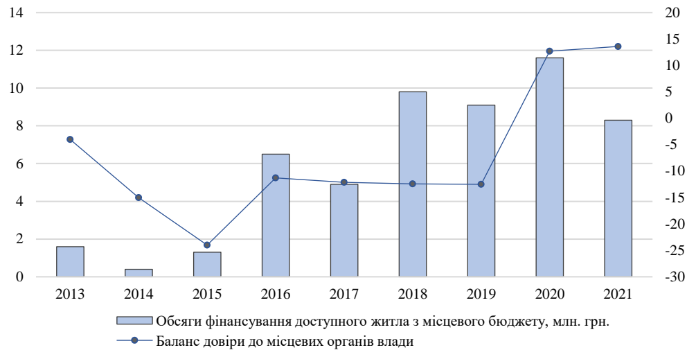
Рисунок 4 – Динаміка показника балансу довіри до органів місцевого самоврядування в Україні та динаміка обсягів фінансування програми «Доступне житло» з місцевих бюджетів за 2013-2021 роки Джерело: побудовано на основі [13], [16], [17]

органів влади коливалось від -25 у 2015 році до 13,6 у 2021 році. Ці коливання мають значно меншу амплітуду у порівнянні з балансом довіри до уряду. Так, починаючи з 2016 року, при зростанні обсягів фінансування програми «Доступне житло» з місцевих бюджетів, баланс довіри/недовіри складав не менше -12,5.