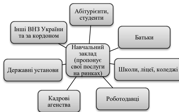
Рисунок 1 – Суб'єкти ринку освітніх послуг

Навчальні заклади сьогодні виступають «виробниками» та «продавцями» освітніх послуг, а учні, батьки, та студенти є споживачами, виступають суб'єктами ринку освітніх послуг. Крім того, прямо чи опосередковано ВНЗ контактують з іншими суб'єктами — підприємствами та організаціями (в яких працюють випускники вищих навчальних закладів), фінансовими фондами, видавництвами журналів, кадровими агентствами і т.п. (рис. 1)