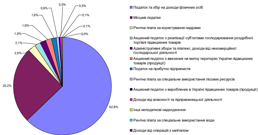
Рисунок 1 – Структура зведеного бюджету Сумської області у 2019 році.

Структура зведеного бюджету Сумської області у 2019 році наведена на рисунку 1.