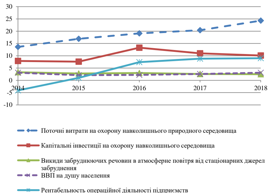
Рисунок 3 – Співставлення динаміки показників розвитку України протягом 2014-2018 років

Нещодавно «Фокстрот» презентував свій дванадцятий звіт в якому сказано, що стратегія розвитку групи компанії клієнторієнтована, а також всі соціальні проекти системні, звірені із соціальною державною політикою та підтримують діяльність державних органів влади у вирішенні нагальних соціальних проблем.