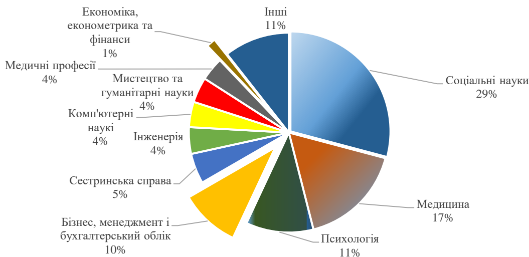
Рис. 2. Аналіз БД Scopus рівня зацікавленості до теми розвитку методів профорієнтаційної діяльності у розрізі різних галузей

Аналіз БД Scopus дозволив визначити рівень зацікавленості до теми розвитку методів профорієнтаційної діяльності у розрізі різних галузей (рис. 2). Найвищий відсоток досліджень належить соціальним наукам (29,10%). Ця галузь має найвищий відсоток досліджень, що може вказувати на зростаючий інтерес до вивчення соціальних аспектів профорієнтації та розвитку кар'єри. Сюди можна віднести дослідження щодо впливу суспільства, культури, та економічних чинників на вибір кар'єри. Такі галузі як медицина (16,90%) та психологія (10,90%) важливі для вивчення психологічних та фізичних аспектів профорієнтації та психосоматичних аспектів вибору професії. Для галузей бізнес, менеджмент і бухгалтерський облік (9,70%), економіка, економетрика та фінанси (1,5 %) важливим є дослідження стратегій кар'єрного росту, управління ресурсами та планування кар'єри в бізнес-середовищі. Велика частина досліджень (інші, 10,60%), які не вписуються у конкретні категорії, може включати в себе нові підходи до профорієнтації, а також дослідження, які охоплюють кілька галузей одночасно.