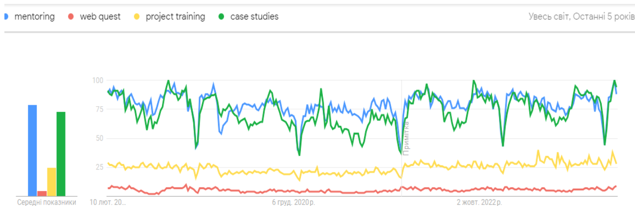
Рис. 4. Рівень громадської зацікавленості до різних методів навчання, що використовуються у профорієнтаційній діяльності за 2019 – 2023 рр.

Під час аналізу науково-літературних джерел та даних БД Scopus були визначені такі інструменти профорієнтаційної діяльності: менторінг, Web-Quest-технології, проєктне навчання, проблемне навчання, case study. Популярність зазначених методів досліджено за допомогою програмного забезпечення Google trends.