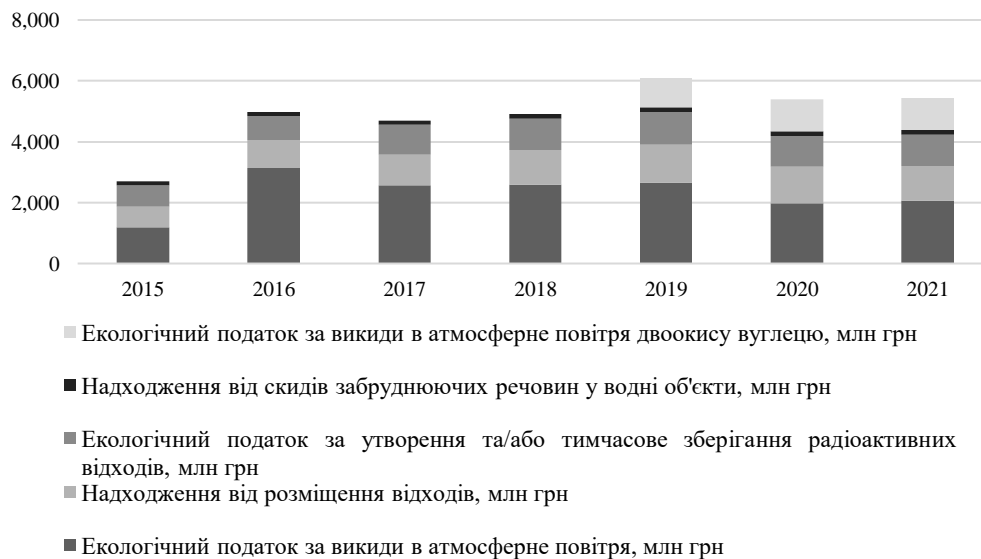
Рис. 4. Структура екологічних податків в Україні протягом 2016 – 2021 рр., млрд грн

Аналіз системи екологічного оподаткування в Україні передбачає також дослідження її структури – рис. 4. Це пов'язано витікає з основної мети проведення аналізу ефективності сплати екологічних податків в напрямку впровадження нових або вдосконалення діючих видів податків, що будуть спонукати до більш раціонального використання невідновлювальних природних ресурсів нашої країни.