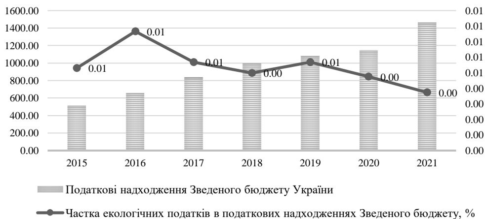
Рис. 2. Динаміка частки від сплати екологічних податків у податкових надходженнях зведеного бюджету України протягом 2015 – 2021 рр., млрд грн

Фіскальний потенціал екологічного оподаткування також можна перевірити через проведення аналізу коефіцієнта покриття податковими надходженнями в частині сплати екологічних податків певних видатків, пов'язаних з охороною навколишнього середовища в динаміці (рис. 3).