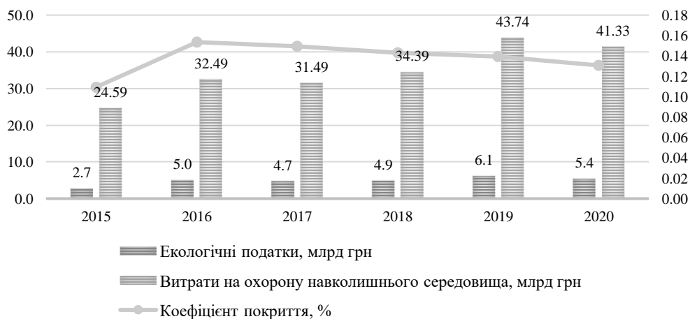
Рис. 3. Динаміка коефіцієнта покриття екологічними податками видатків на охорону довкілля протягом 2015 – 2020 рр., млрд грн.

Фіскальний потенціал екологічного оподаткування також можна перевірити через проведення аналізу коефіцієнта покриття податковими надходженнями в частині сплати екологічних податків певних видатків, пов'язаних з охороною навколишнього середовища в динаміці (рис. 3).