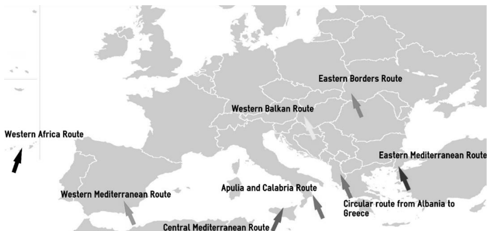
Рисунок 2 – Основні міграційні маршрути в ЄС [9]

Європейські інституції склали карту основних маршрутів, якими користуються біженці, щоб прибути на континент. На Рис. 2 показано, наскільки складна ситуація. Крім того, є альтернативні шляхи, якими біженці прямують до Росії, щоб перетнути кордон до Норвегії. Цей маршрут відрізняється від інших великими витратами для мігрантів, тому він є для багатьох з них недоступним.