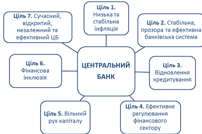
Рисунок 2 - Стратегія Національного банку [13]

Зокрема, навесні 2018 року ухвалено стратегію Національного банку, якою визначено сім ключових цілей його діяльності (рис.2).